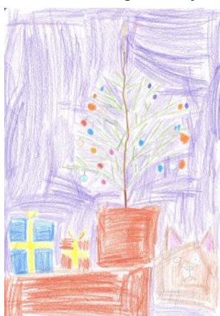
Ilustrace: Domis, 5.A